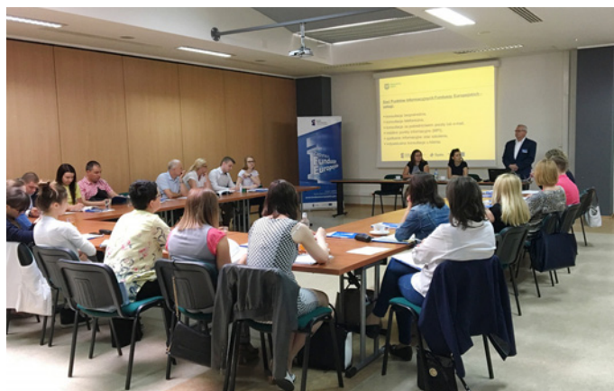
Podczas spotkań informacyjnych przedstawiono możliwości pozyskania środków z EFS w ramach RPO WSL 2014-2020