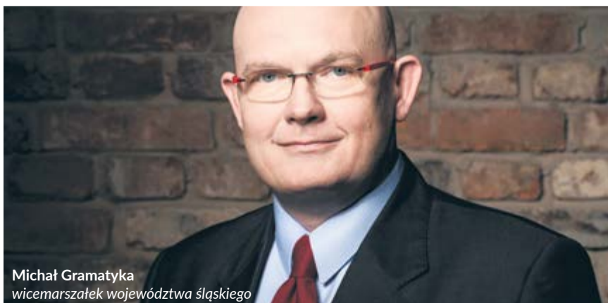
Michał Gramatyka wicemarszałek województwa śląskiego

W ramach pierwszego typu projektu fundusze przeznaczone są na tworzenie lub rozwój istniejącego zaplecza badawczo-rozwojowego w przedsiębiorstwach, służącego ich działalności innowacyjnej. To oznacza, że pieniądze otrzymają firmy, które utworzą, rozbudują lub zmodernizują infrastrukturę do prowadzenia przez nie prac B+R. Drugi typ projektu daje tym razem szersze możliwości – przedsiębiorcy mogą sfinansować badania przemysłowe i prace eksperymentalno-