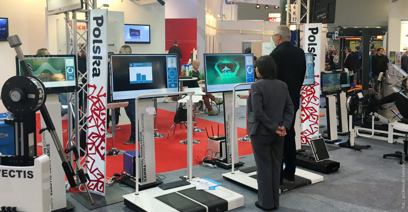
Technomex regularnie prezentuje swoje produkty podczas targów