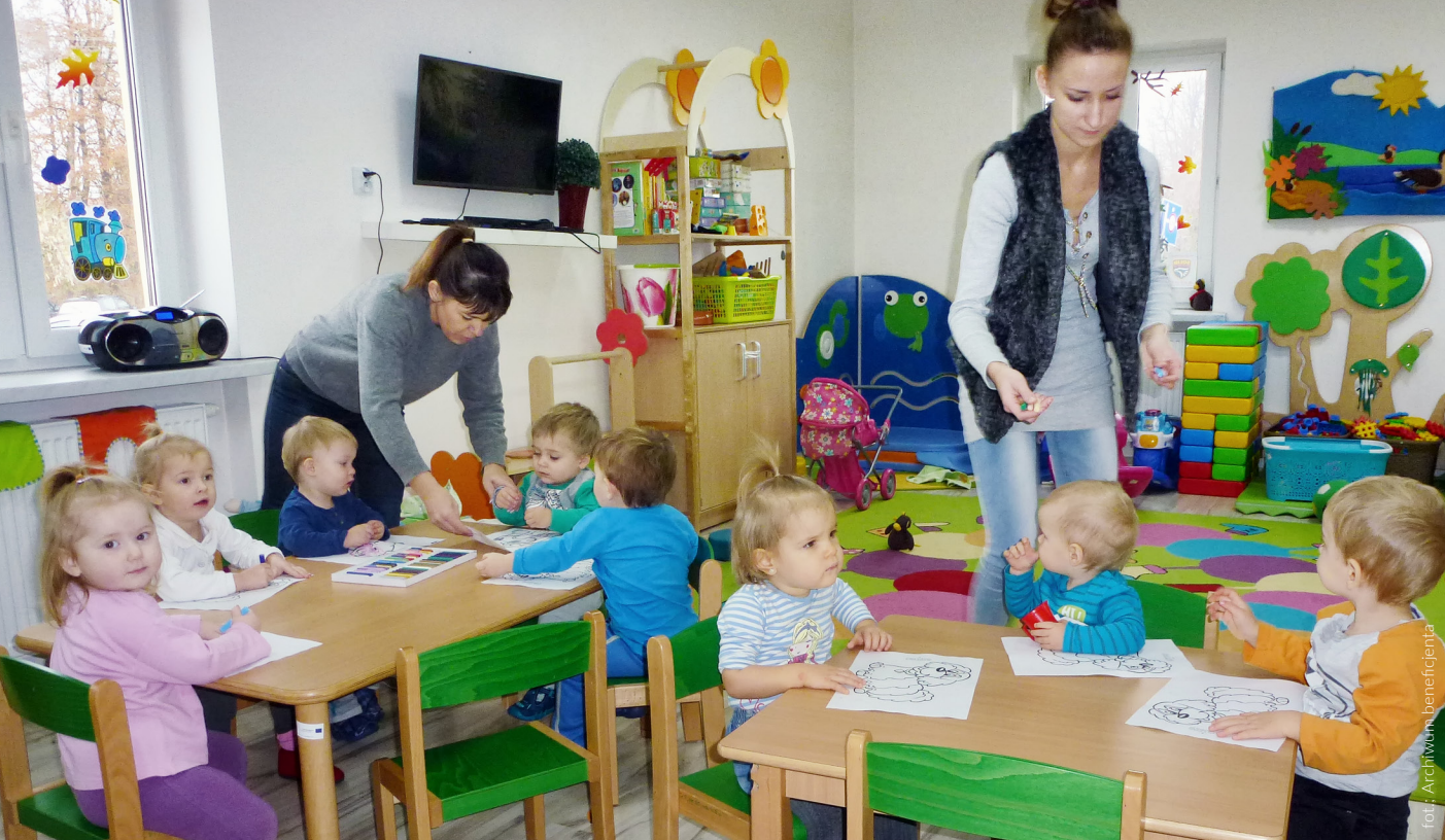
Klub Dziecięcy „Karol” w Pisarzowicach