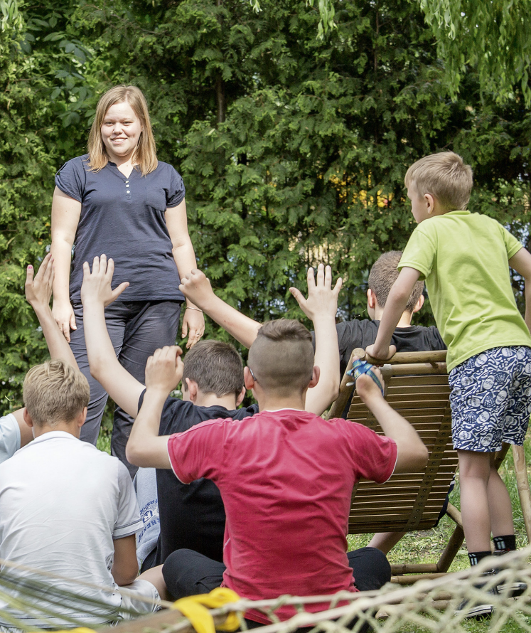
Dzięki unijnym środkom dzieci z domów dziecka trafią do rodzin zastępczych

(Poddziałanie 9.2.3 Rozwój usług społecznych i zdrowotnych – OSI ). Będzie on dotyczyć Obszarów Strategicznej Interwencji, tj. Bytomia i Radzionkowa.