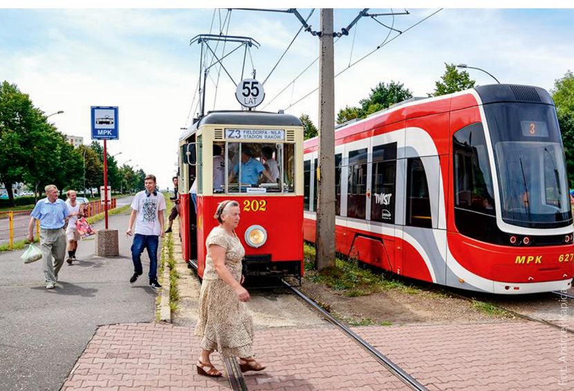
Nowa linia łączy dzielnice z centrum miasta