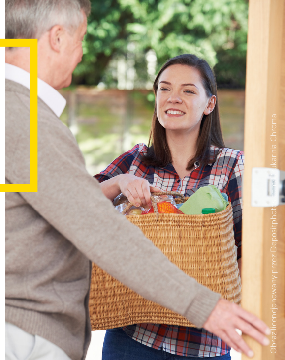
Wsparcie sąsiadów i wolontariuszy to kluczowy element projektu

Teleopieka, nadzór lekarski, wsparcie wolontariuszy i pomoc sąsiedzka to najważniejsze elementy pilotażowego projektu „Asystent Seniora”, realizowanego w Poznaniu. Przedsięwzięcie udowodniło, że kompleksowe wsparcie świadczone w środowisku lokalnym jest skuteczną alternatywą dla tradycyjnych „domów spokojnej starości”.