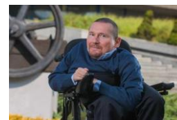
MAREK PLURA , Poseł do Parlamentu Europejskiego